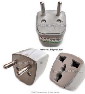
หัวแปลงจากแบนเป็นหัวกลม