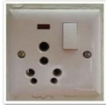
เต้าเสียบ

ปลั๊กไฟที่เนपालเป็นแบบสามรูหัวกลมไฟ 220 โวลท์